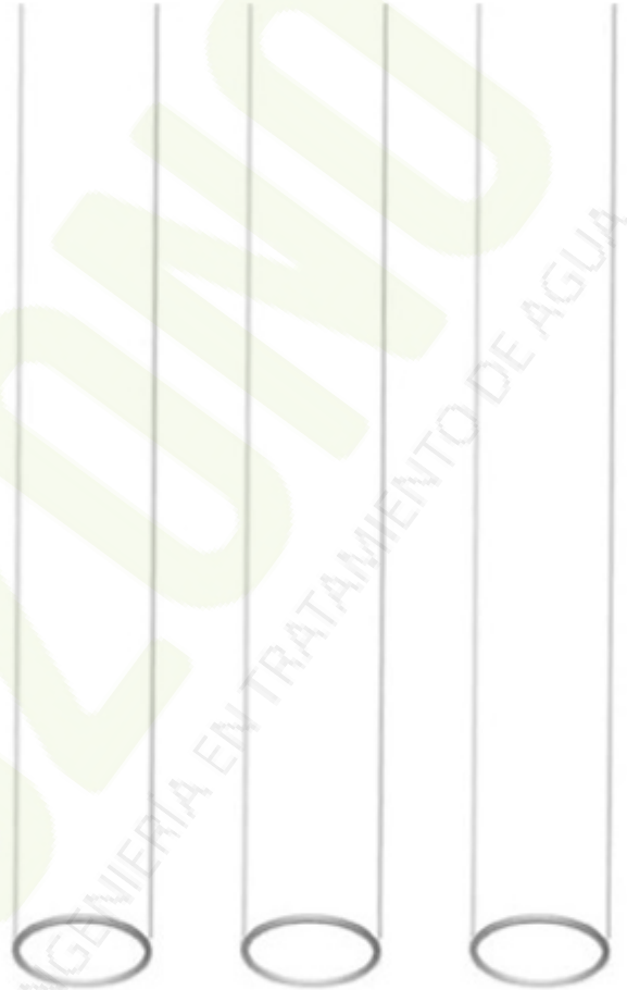
Manga de Cuarzo