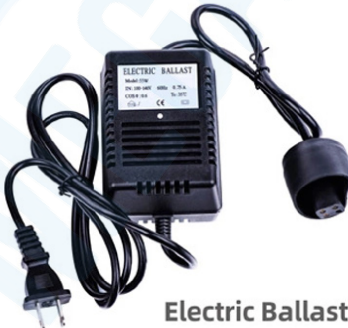
Electric Ballast (CE Certified)